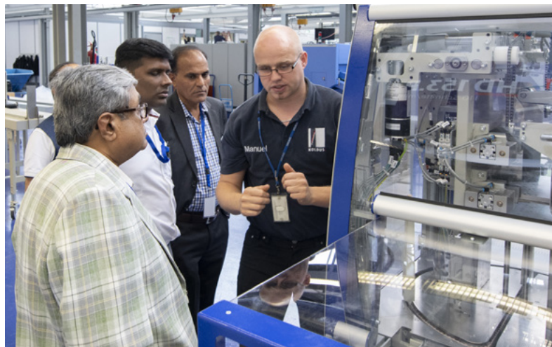
Kunden aus aller Welt lassen sich im Blauen Salon die aktuellen Maschinen vorführen.